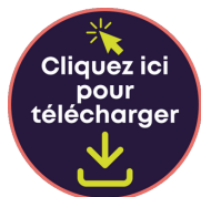
Tableau de visualisation

Incitez les jeunes à répondre à la question « La persévérance scolaire, c'est... » sur un papillon autocollant (de marque Post-it ou autre). Collez tous les papillons autour du carton, de manière à créer une murale.