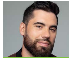
LAURENT DUVERNAY-TARDIF porte-parole des Journées de la persévérance scolaire (JPS)